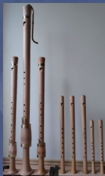
ルネサンスリコーダー・コンサートセット 「HIER-S」ターヴィ＝マッツ・ウット製作 2023年